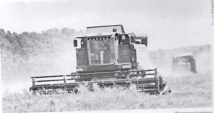
Обмолот озимых культур