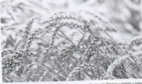
После выдержки и морозов, и льда