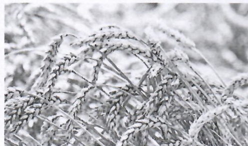
Растения выдержали и морозы, и засуху